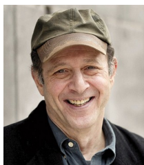
Steve Reich est né en 1936, il a 86 ans.

Dans le morceau Nagoya Marimba composé en 1994, Steve Reich a écrit des _____ qui se _____ et sont jouées de manière _____ que l'on appelle le déphasage et qui donne ici une impression d'_____. Les compositeurs de musique répétitive cherchent à créer un caractère méditatif visant à réconcilier l'homme et l'univers.